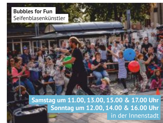
Bubbles for Fun Seifenblasenkünstler

Samstag um 11.00, 13.00, 15.00 & 17.00 Uhr Sonntag um 12.00, 14.00 & 16.00 Uhr in der Innenstadt