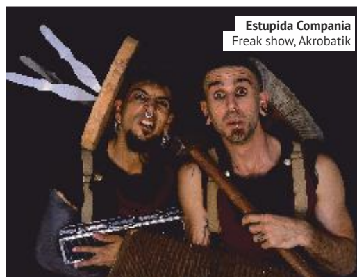
Estupida Compania Freak show, Akrobatik